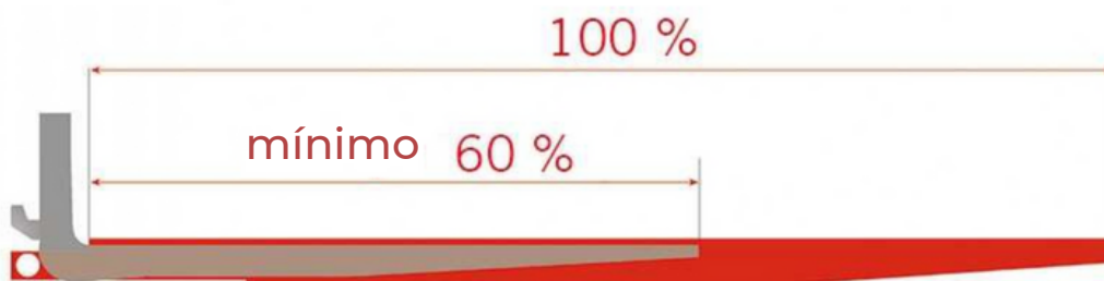
Figura 2. Condiciones de uso de las extensiones de horquilla