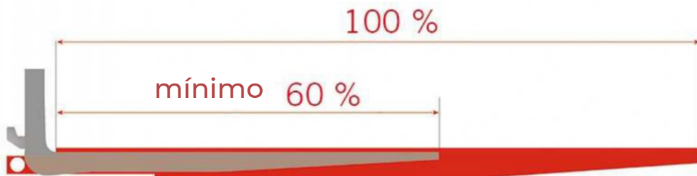
Figura 2. Condiciones de uso de las extensiones de horquilla